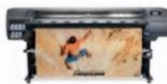
HP Latex 335 (Ref.: V7L47A)