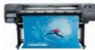
HP Latex 315 (Ref.: V7L46A)