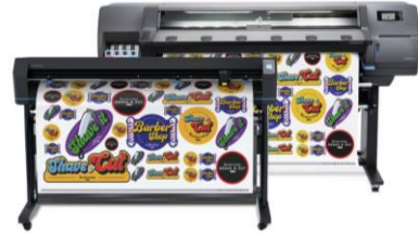
Solución de impresión y corte HP Latex 315 (Ref.: 9TL96A)