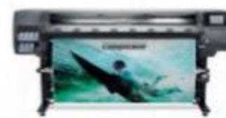
HP Latex 365 (Ref: V8L39A)