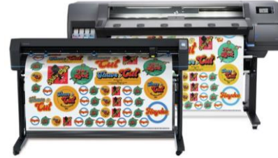
Solución de impresión y corte HP Latex 315 (Ref.: 9TL95A)