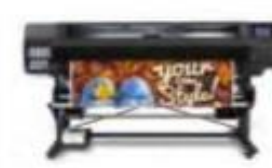
HP Latex 560 (Ref.: M0E29A)