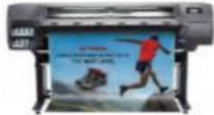
HP Latex 115 (Ref.: 1QE01A)